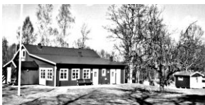
Församlingens sommargård Västragård

Fårbo Frikyrkoförsamling Hagadalsvägen 23 572 76 Fårbo www.hagadalskyrkan.com